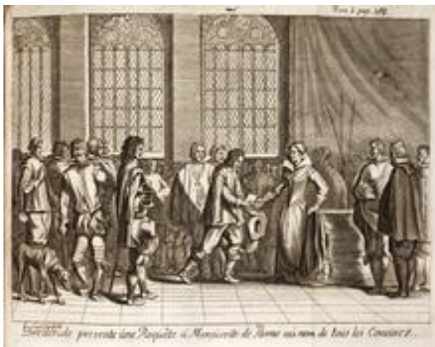
Smeekschrift van de edelen, 1566