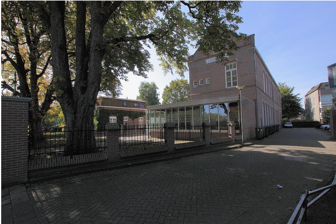
Einde Burgakker te Boxtel met voormalige Levensschool, thans (2014) in gebruik door SintLucas. Vooraan rechts stond de pastorie (zie desbetreffende zwartwitfoto).