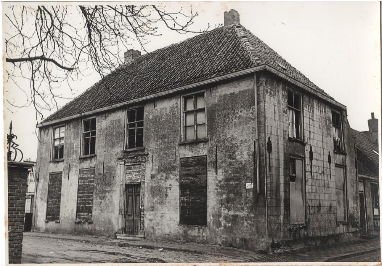
Pastorie schuurkerk aan Burgakker te Boxtel. Waarschijnlijk kort voor de sloop ca. 1960. Links is de gemetselde pilaar zichtbaar van het hekwerk bij de Levensschool.