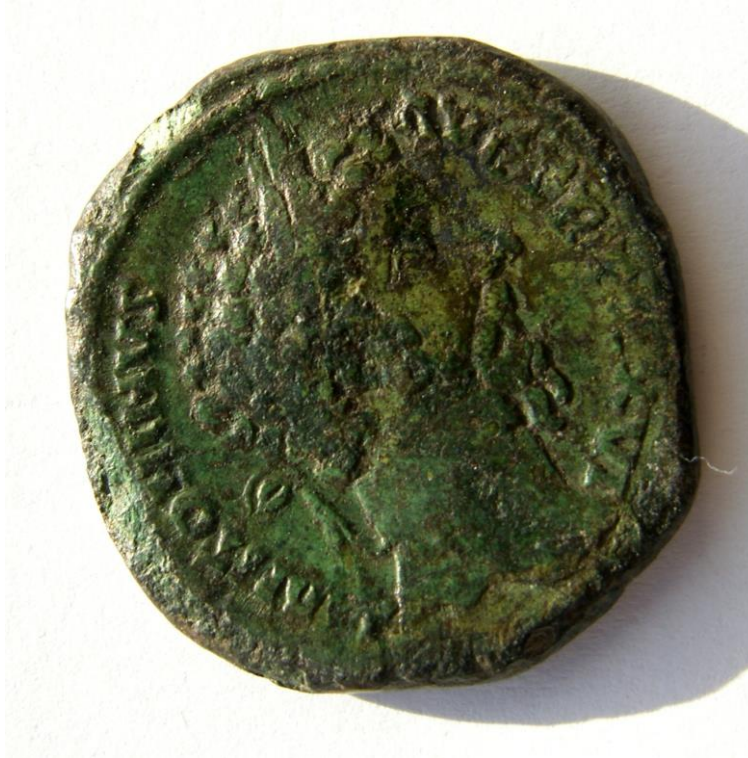
Munt gevonden in Boxtel 2005

gouden munt gevonden van keizer Marcus Aurelius uit 181 na Chr. Deze munt werd Sestertius genoemd. Marcus Aurelius was de filosoof-keizer. Zijn beide zoons ruzieden over de opvolging. Hier zijn boek en film "The Gladiator" op geïnspireerd.