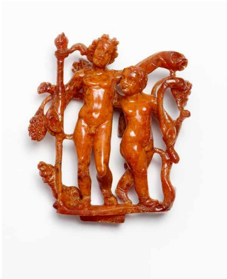
Barnstenen beeldje 8cm hoog van de wijngod Bacchus gevonden in Esch

De huizen waar de mensen gewoond hebben zijn –tot op heden- niet gevonden in Esch. Ze zijn naar alle waarschijnlijkheid niet van hout maar van steen geweest.