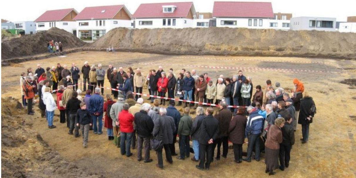
Bij Einsteinstraat in Munsel 2008

Archeologen graven de zwarte laag weg en zien in het vlak van geel zand zwarte vlekken die de kuiltjes aangeven.