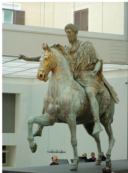
Beeld van Marcus Aurelius voor huidige stadhuis van Rome

Marcus Aurelius staat tegenwoordig achterop de Italiaanse munt van 50 eurocent.