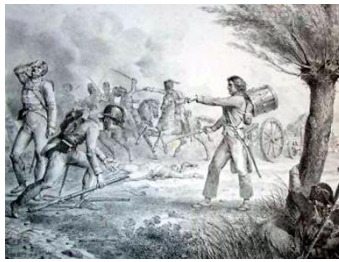
C.1.: Combat de Boxtel, 1794