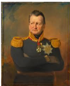
B.3.: David Hendrik Chassé (1765-1849)

Toen de Fransen Willem v in 1792 de oorlog verklaarden, richtte Daendels bovendien met Franse toestemming vanuit korpsen van uitgeweken patriotten het Bataafse Vreemdelingen Vrijwilligers Legioen op, dat zij aan zij met de Fransen de Republiek zou bevrijden van Willem v.