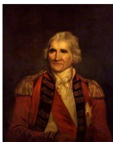
A.2.: Ralph Abercromby (1734-1801)

Langs de Dommel onderhield Yorks coalitie ook een reeks vooruitgeschoven buitenposten, onder meer in Sint-Michielsgestel, Boxtel en Sint-Oedenrode, en ook in Aarle aan de Aa. Deze werden bemand door de troepen van majoor-generaal Rudolf von Hammerstein, die het commando voerde over de eenheden uit Hannover, Hessen-Darmstadt en Hessen-Kassel. 15 De meeste bruggen over de Dommel waren met uitzondering van die bij Sint-Oedenrode uit voorzorg verwijderd. Ook de sluizen bij de watermolens waren verwijderd zodat het laagland rondom 's-Hertogenbosch al gauw geïnundeerd raakte. Boxtel werd daardoor plots van strategisch belang als een van de weinige plaatsen waar de rivier gepasseerd kon worden. De geplande Franse aanval verliep daardoor anders dan gedacht: in plaats van rechtstreeks door te stoten naar Fort Isabella bij Vught (van waar 's-Hertogenbosch beschoten kon worden) werd de stad vanuit verschillende richtingen in een omtrekkende beweging benaderd. Boxtel, Schijndel, Berlicum en Heeswijk lagen daardoor in het pad van de Fransen. 16