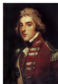
A.3.: Arthur Wesley (1769-1852)