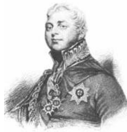
A.1.: Frederick, Hertog van York en Albany (1763-1827), Gravure 1790

Op 14 en 15 september 1794 was Boxtel de inzet van een kleine veldslag tussen het oprukkende, Franse Noordelijke Leger en een coalitie van Staatse en Britse troepen, versterkt met Hessische en Hannoveriaanse eenheden. Wellicht onterecht is deze slag onbekend gebleven, aangezien de gevechtshandelingen kunnen worden aangemerkt als de 'vuurdoop' van Arthur Wesley, de latere hertog van Wellington die Napoleon eenentwintig jaar later de definitieve nederlaag toebrengt bij Waterloo. 1 Een andere reden die de slag vermeldenswaard maakt, en waar de slag in het Verenigd Koninkrijk wellicht meer bekendheid om geniet, is de connectie met de herkomst van de bijnaam 'Tommy' die vanouds voor Britse soldaten werd gebruikt. In het kader van de val van de Republiek der Verenigde Nederlanden is de slag vermeldenswaardig als het moment waarop de laatste verdediging tot aan de vestingen van 's-Hertogenbosch en Grave wegviel, waarna de Franse opmars naar de grote rivieren en de daaropvolgende inname van Utrecht en Holland niet meer te stuiten was.