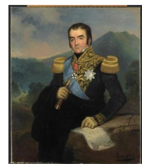
B.4.: Herman Willem Daendels (1762-1818)