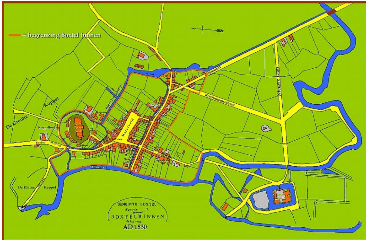
Centrum Boxtel (oude naam Boxtel binnen) met Dommel en Binnendommeltjes.