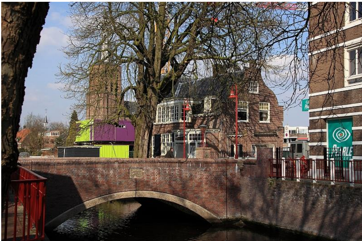
Zwaanse Brug in de Rechterstraat te Boxtel.